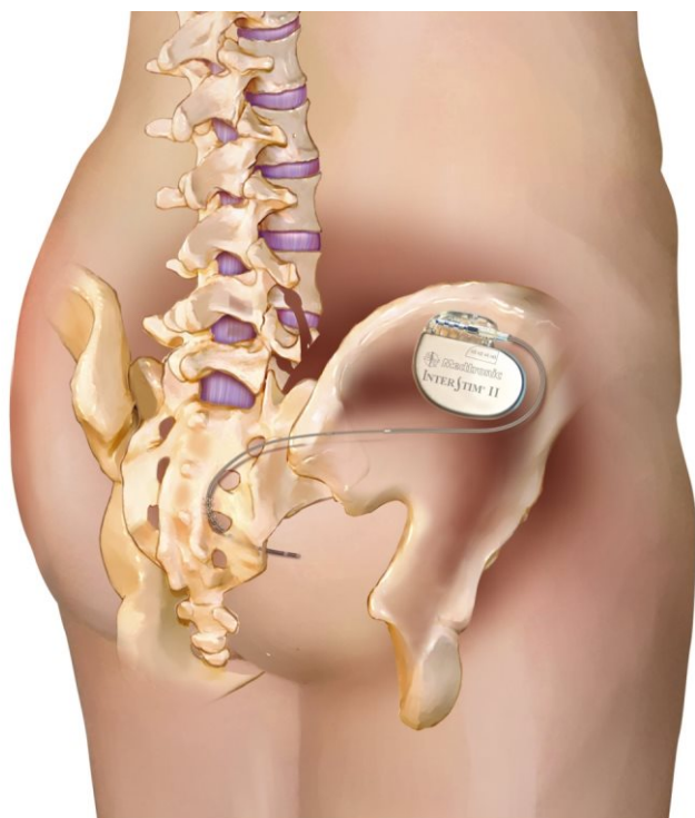
2e fase, definitieve plaatsing inwendige neurostimulator