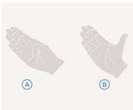
Figuur 3: Oefening duim

Beweeg de duim langs naar de top van de pink en beweeg hem langs de pink naar beneden. Strek de duim daarna weer volledig.